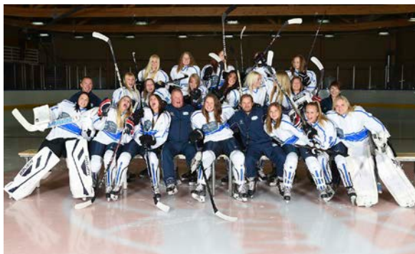
Team Kuortane, Naisten SM-sarja