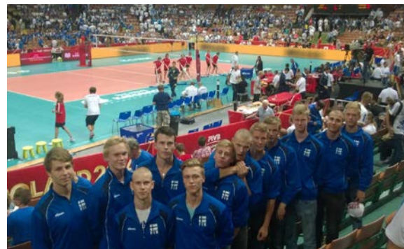
Team Kuortane, Miesten 1-sarja