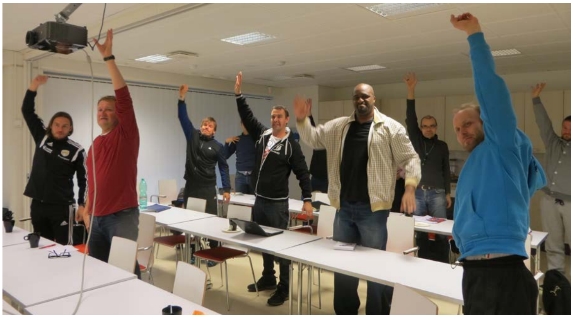
Seinäjoen akatemiavalmentaja- ja opopalaverin jumppatauko